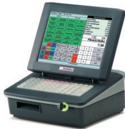
Abbildung: INKA 450 mit Bondrucker